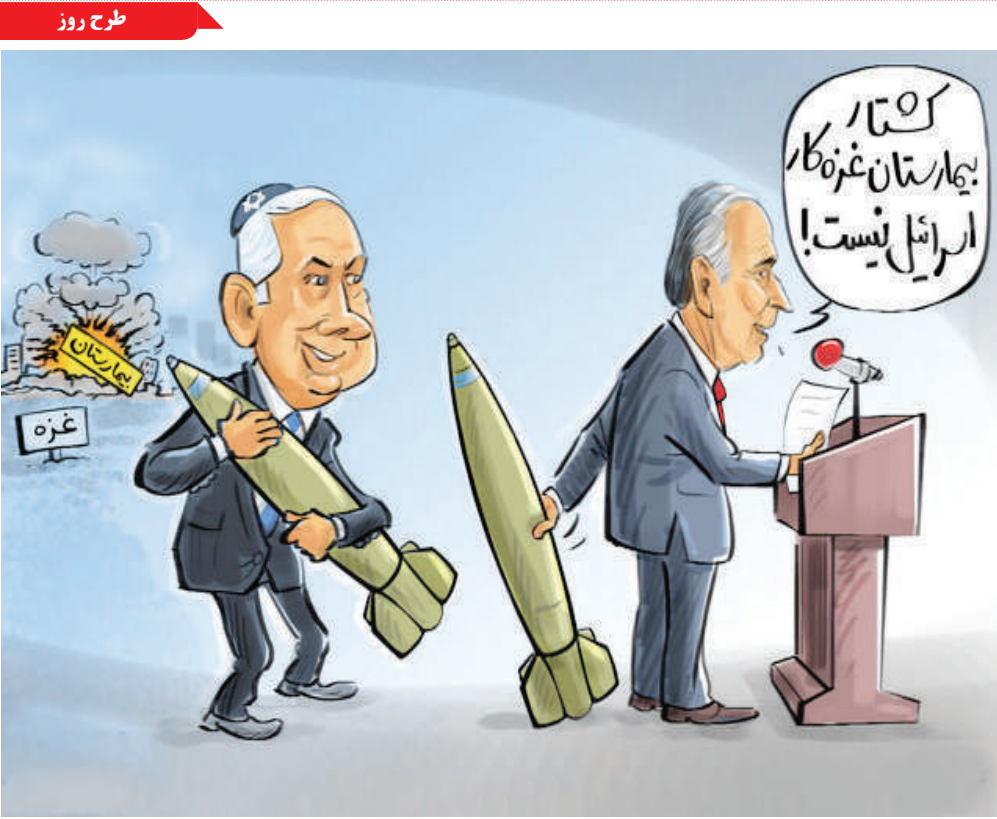
بمب‌های آمریکایی روی سر مردم غزه

♦ چه زمانی ویتامین مصرف کنیم؟ از آنجایی که ویتامین‌ها باید زمانی مصرف شوند که بتوانند به بهترین شکل جذب بدن شما شوند، در اینجا به توضیح زمان مصرف برخی ویتامین‌ها می‌پردازیم: ♦ صبح تمام ویتامین‌های B (به جز فولات) در فرآیند تولید انرژی بدن شما نقش دارند. بنابراین، مکمل‌های این ویتامین‌ها ممکن است اثر انرژی را داشته باشند. به عنوان مثال، بهتر است ویتامین B12 را صبح مصرف کنید. مصرف ویتامین B6 در طول روز نیز مهم است. هنگامی که در شب مصرف شود، می‌تواند با خواب تداخل داشته باشد و باعث دیدن رویاهای واضح شود. ♦ بعدازظهر ویتامین E یک آنتی‌اکسیدان است و برای افرادی که مشکل خواب دارند فواید زیادی دارد. از آنجایی که ویتامین E اثر محافظتی عصبی دارد، بهتر است آن را عصرها یا شب‌ها مصرف کنید. می‌توانید مکمل‌های ویتامین E را با شام یا درست قبل از رفتن به رختخواب مصرف کنید. ♦ با غذا برخی از ویتامین‌ها، به ویژه ویتامین‌های محلول در چربی A، D، E و K برای جذب حداکثری باید همراه غذا مصرف شوند. ویتامین D به طور ایده‌آل باید با بزرگترین