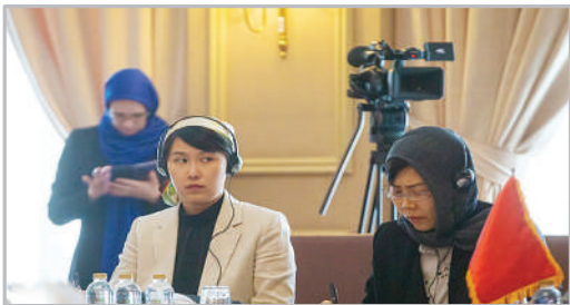
نشست گروه تماس منطقه‌ای برای افغانستان - تهران