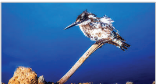
حیات وحش منطقه «چمیم»