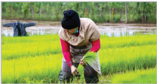
نشای برنج - کیلان