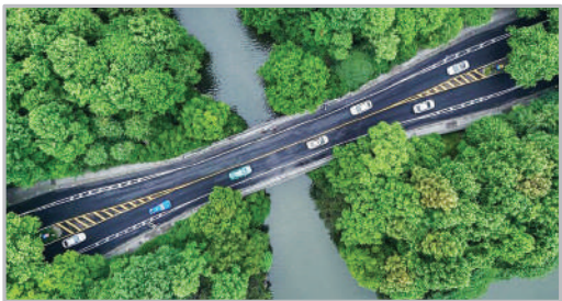
جاده‌ای جنگلی در هانتونگ - چین