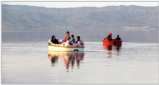
دریاچه مهالو - شیراز